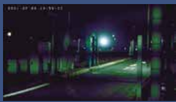
ローリングシャッター

歪みが発生しやすいローリングシャッターではなく、全面素同じタイミングでシャッターを切るグローバルシャッター搭載のカメラなので、動体物に歪みが発生しません。