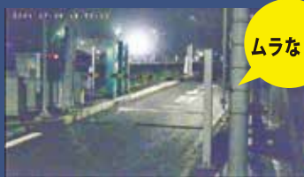
グローバルシャッター