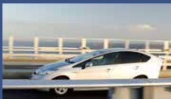
ローリングシャッター