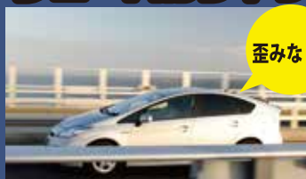
グローバルシャッター